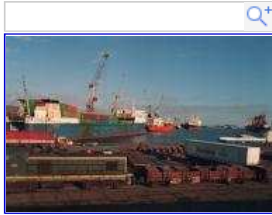
Vue du port de Dunkerque en 1993